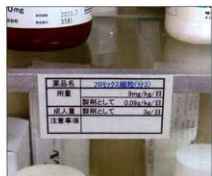
「散剤液剤確認カード」(ブリスクリプション エルム&バーム)