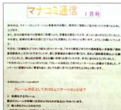
「マナコミ通信」(トミザワ薬局)

同委員会の「マナコミ通信」は06年から発行を開始した。約2カ月に1回の頻度で作成し、全店舗に毎回、